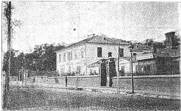
Больница Пресвятой Дѣвы Маріи.