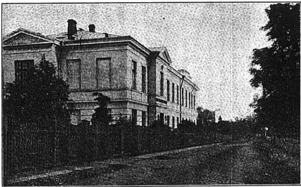
Школа ремесленныхъ учениковъ.