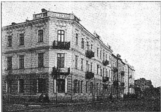
8-ми классная школа съ курсомъ мужскихъ гимназій Вацделъ Радлинскаго.

дѣятельность этого общества состоитъ въ изысканіи средствъ для внесенія платы за недостаточныхъ учениковъ. Съ начала учебнаго года 1911/12 года при школь