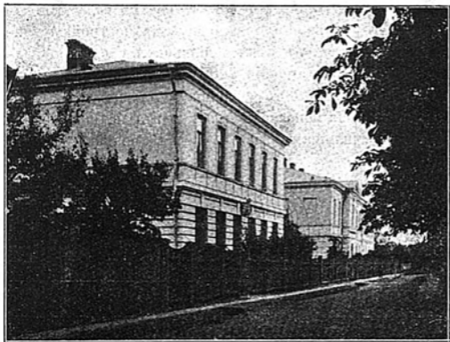
1-ья Мужское и женское начальныя училища.

Въ 1896 г., когда предполагалось расширить зданіе мужской гимназіи устройствомъ при немъ ученическаго общежитія и квартиръ для воспитателей, появилась необходимость воспользоваться земельнымъ, соедѣннымъ съ гимназіею, участкомъ, на которомъ находились эти училищныя строенія, и тогда же Попечителемъ Варшавскаго Учебнаго Округа былъ поднятъ вопросъ о постройкѣ для начальнаго училища новаго зданія на новомъ мѣстѣ, а въ крайнемъ случаѣ, на площади, отведенной подъ огороды для учителя и учительницы того же училища.