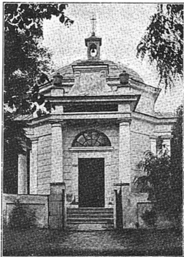
Часовня княгини Огинской.