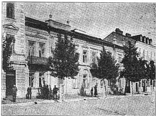
Женское коммерческое училище Ядвиги Барщевской.

Женское коммерческое училище Ядвиги Барщевской. Училище находится въ вѣдѣніи М-ва Торговли и Промышленности. Основанное въ 1904 году въ составѣ 2-хъ классовъ, училище преобразовано въ 1906 году въ 7-ми классное, а въ 1911 г. въ 8-ми классное. Въ первый годъ существованія училища, въ немъ было 47 ученицъ, въ 1911 г. 209. (римско-католическаго вѣ-