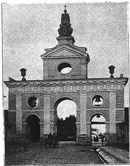
Коднольня при костелѣ.