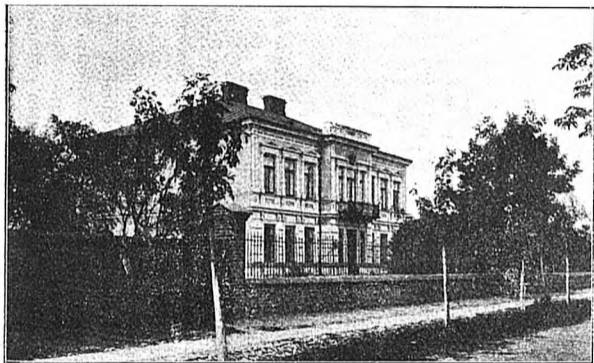
Общестіе женской гимназіи. (б. пріютъ).